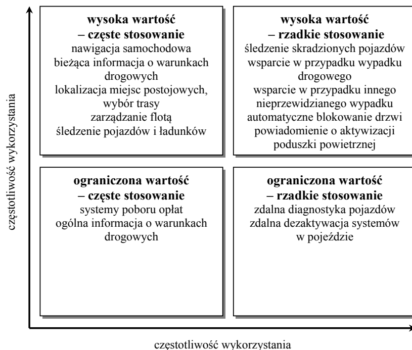
Rys. 2. Technologie ITS wykorzystywane w pojazdach