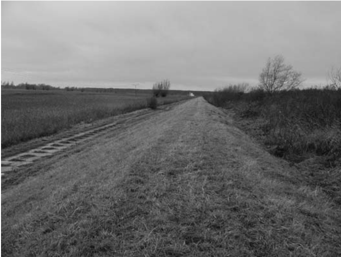
Rys. 1. Widok nasypu na polderze 76 w miejscowości Nowe Dolno zmodernizowanego z zastosowaniem metody zagęszczania udarowego po 13 latach eksploatacji budowli

W drugim etapie, po rozbudowaniu i podwyższeniu nasypu wybito kinetę w nadbudowanej części metodą udarową, wykonując rdzeń szczelny, którego oś pokrywała się z osią rdzenia w starym nasypie.