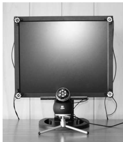
Rys. 1. System śledzenia punktu fiksacji wzroku

W ramach projektu kluczowego MULTIMODAL, prowadzonego w KSM opracowywany jest interfejs multimodalny oparty na śledzeniu punktu fiksacji wzroku na monitorze. W większości, systemy tego typu (ang. eye tracking systems ) charakteryzują się pracą w czasie rzeczywistym, dzięki czemu możliwe jest zbieranie informacji o tym, które fragmenty obrazu wyświetlane na monitorze koncentrują na sobie wzrok użytkownika w określonym momencie [1] [2]. System spełnia założenia projektu dotyczące parametrów technicznych: rozdzielczości czasowej – 5 klatek (ang. frames ) na sekundę, oraz rozdzielczości przestrzennej – precyzyjne rozróżnianie 9 obszarów na ekranie monitora (3x3). W tym miejscu należy zaznaczyć, że w rzeczywistych warunkach, po przeprowadzeniu procesu kalibracji, system zapewnia znacznie wyższą rozdzielczość przestrzenną. Rys. 1 przedstawia konfigurację sprzętową systemu śledzenia punktu fiksacji, opracowywanego w KSM.