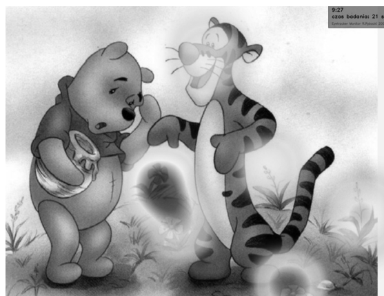
Rys. 5. Przykładowe mapy cieplne:

a) ucznia skoncentrowanego; b) ucznia mającego problemy z koncentracją