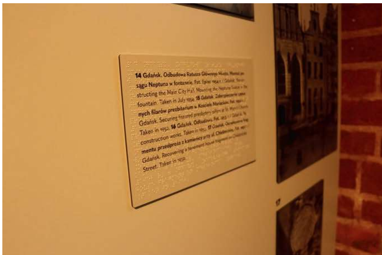
Ryc. 6 Plansza tekstowa z podpisami w języku Braille'a na wystawie „Ruiny i odbudowa w fotografii Macieja Kilarskiego”, fot. A. Kowalska.

Omawiając możliwe udogodnienia poprawiające dostępność oferty wystawienniczej Muzeum Zamkowego w Malborku, warto zauważyć, że sposób konstruowania scenografii i narracji ekspozycji w niewielkim stopniu wpływa na zachowane walory zabytkowe obiektu i co do zasady nie wpływa na nie w sposób trwały. Poza naszą świadomością projektowanych współcześnie barier nie ma zatem większych ograniczeń w przygotowywaniu dostępnych wystaw w przestrzeni malborskiego zamku, w tym ograniczeń konserwatorskich.