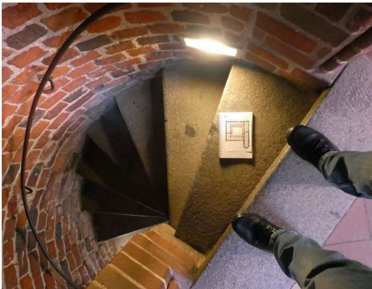
Ryc. 3 Zamek Wysoki w Malborku. Typowa klatka schodowa; leżący na stopniu notes formatu A5 pokazuje skalę szerokości biegu

Największy problem stanowią klatki schodowe. Jest ich kilkanaście, ale są rozmieszczone nieregularnie, strome i o bardzo wąskich (ok. 65 cm), często krętych biegach (Ryc. 3); wyjątkiem jest wspomniana, prowadząca przed bramą na I piętro. Wszystkie są niełatwe do pokonywania, także dla osób w pełni sprawnych fizycznie, a nawet niebezpieczne. Jedyna możliwość wbudowania klatki schodowej wraz z szybem dźwigu istnieje w przestrzeni wieży (danskeru), połączonej krytą galerią z południowo-zachodnim narożnikiem krużganku na I piętrze. Byłoby to rozwiązanie nienaruszające średniowiecznej substancji zabytku (sklepienie wieży nie jest oryginalne), nieagresywne estetycznie i skutecznie rozwiązujące zarówno problem transportu, jak i ewakuacji, zwłaszcza osób z niepełnosprawnością. Nie likwidowałoby oczywiście problemów na kondygnacjach położonych wyżej, ale pozwalałoby na pełne udostępnienie najbardziej reprezentacyjnych pomieszczeń usytuowanych na I piętrze zamku – przede wszystkim kościoła, refektarza i krużganków. Usytuowanie zewnętrznych pionów komunikacyjnych (schodów i dźwigów) nie wydaje się ani celowe, ani możliwe do zaakceptowania ze względów architektoniczno-konserwatorskich. Dźwig usytuowany w przestrzeni dziedzińca nie byłby w stanie obsługiwać wszystkich kondygnacji, a – mimo „odwracalności”, czy możliwego do osiągnięcia estetycznego minimalizmu rozwiązania – tworzyłby element zbyt inwazyjny (Ryc. 4).