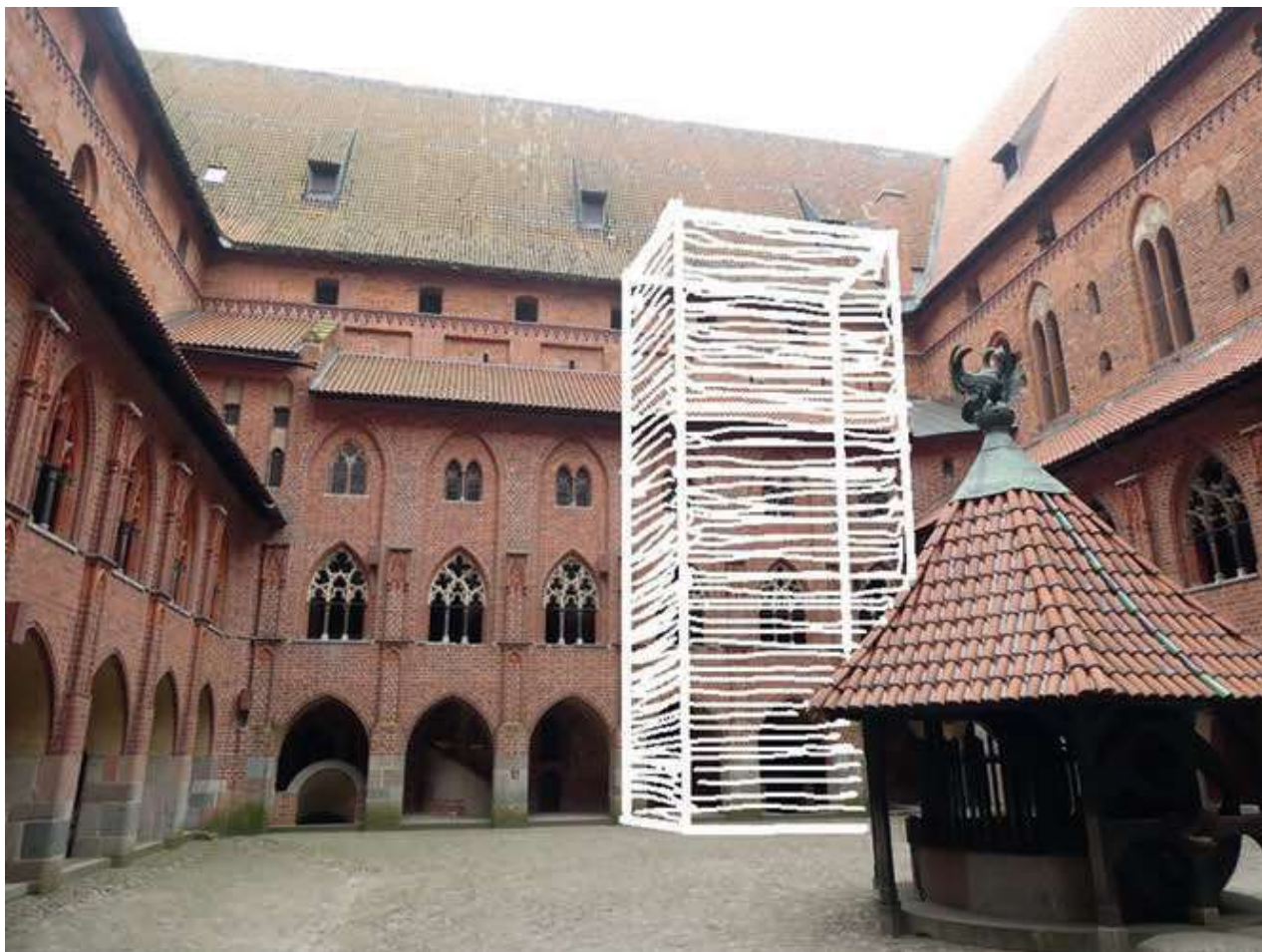
Ryc. 4 Zamek Wysoki w Malborku, dziedziniec. Szkicowa wizualizacja kubatury szybu mieszczącego dźwig i klatkę schodową; możliwa do zaakceptowania, oprac. G. Bukal.

Sytuowanie natomiast szypów dobudowanych do ścian zewnętrznych (elewacji) nie powinno być brane pod uwagę z uwagi na ekspozycję każdej z nich od strony miasta oraz w panoramie zamku od strony Nogatu. Prawdopodobnie zresztą jeden taki pion komunikacyjny nie poprawiłby sytuacji całego obiektu.