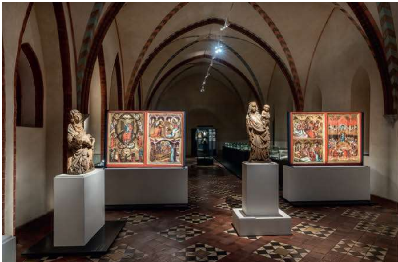
Ryc. 5 Wnętrze dormitorium na Zamku Wysokim w trakcie wystawy „Sapientia aedificavit sibi domum...”

Pomimo wdrażania standardów Narodowego Instytutu Muzealnictwa i Ochrony Zbiorów, dotyczących różnych poziomów dostępności ekspozycji, pracownikom Muzeum nie udało się uniknąć tworzenia barier w projektowaniu wystaw muzealnych.