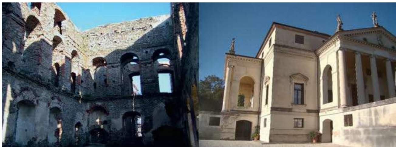
Ryc. 1 Obiekt o strukturze otwartej (Krzyżtopór) oraz obiekt o strukturze zamkniętej (Villa Rotonda, Vicenza)

Zabytki architektury można ogólnie podzielić na dwa typy pod względem struktury architektonicznej. Stronę funkcjonalną można uznać tu za drugorzędną, albowiem często zmieniała się ona w czasie długiego życia obiektu.