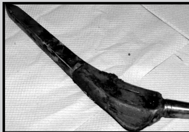
RYS.3. Zmiany korozyjne zachodzące na powierzchni materiału [4]. FIG.3. The corrosion changes occurring on the biomaterial surface [4].

Damaging of the passive surface layer causes a direct contact between cells and the surface of the material. The biomaterial releases the alloy components into the environment surrounding the biomaterial. The corrosion changes occurring on the material surface intensify the inflammation reaction. Its consequence is dieing out of some cells and proliferation of others, which in turn results in remodeling the tissue sticking to the biomaterial [6].