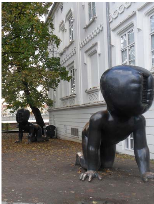
Fig. 9. Infants by David Černy in the Kampa park in Prague.

Ryc. 8. Mimininka autorstwa Davida Černego – Wieża telewizyjna Žižkov w Pradze.