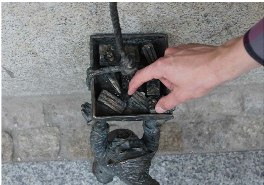
Fig. 10. Wrocław's dwarfs – Ciastuś.

Wrocław Dwarfs (Fig. 10) began to appear in the city since 2005. Currently there are over 300 of them and this number is still growing. They derive from a graffiti from the 80s of the 20th century, which were intended to ridicule the communist system. At this moment, very few know where these little sculptures come from - even the official website of Wrocław Dwarfs does not have information about this. However, they fulfill a valuable function - they are a unique way to promote of the city.