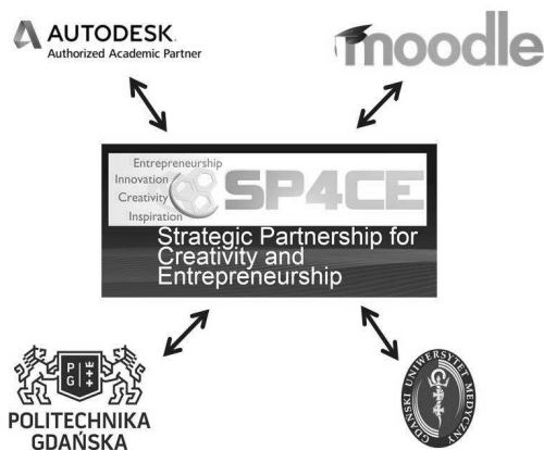
Rys. 1. Schemat współpracy partnerów projektu SP4CE

W projekcie uczestniczyli przedstawiciele dwóch uczelni wyższych – Politechniki Gdańskiej oraz Gdańskiego Uniwersytetu Medycznego, a także pracownicy kilku firm zewnętrznych, które zajmują się szkoleniami i certyfikacją. Schemat współpracy w oparciu o narzędzia e-learningowe został przedstawiony na poniższym rysunku. (Rys. 1.).