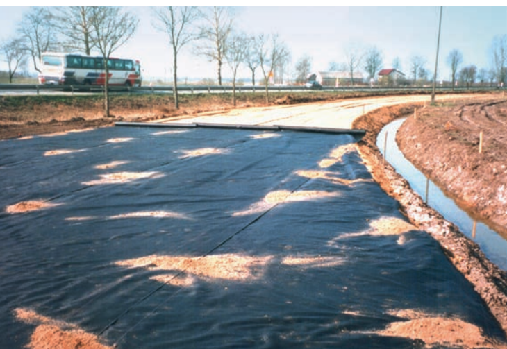
Fot. 1. Warstwa odcinająca z geotkaniny