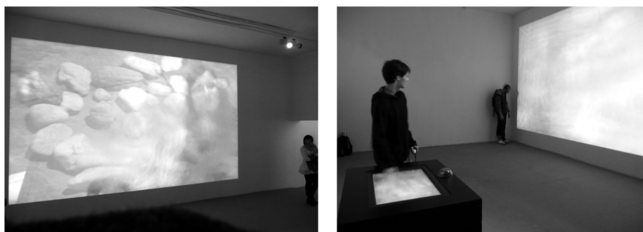
Il. 1, 2. Liquid Views

który pozwala odczuć gdzie są ludzie, jest generatorem przeżyć, doznań odczuwanych przez ludzi na czerwonym dywanie w otaczającym ich urbanistycznym środowisku” [3]. Powstaje coraz więcej realizacji architektonicznych, które angażują nowe technologie, aby sprowokować człowieka do interakcji, kreując w ten sposób zupełnie nowe atrybuty przestrzeni miasta. W przestrzeni tej możliwe jest współdziałanie pomiędzy człowiekiem i budynkiem oparte na elementach nieprzewidywalności, zaskoczenia, ale i interakcji. Zastosowane technologie skupione są na człowieku, na stworzeniu człowiekowi możliwości nowych form komunikacji z otoczeniem.