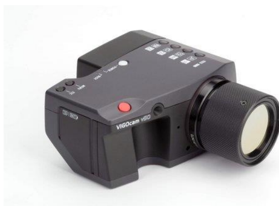
Rys. B.3. Kamera termowizyjna THERM v50 polskiej firmy Vigo System S.A [10, 14].