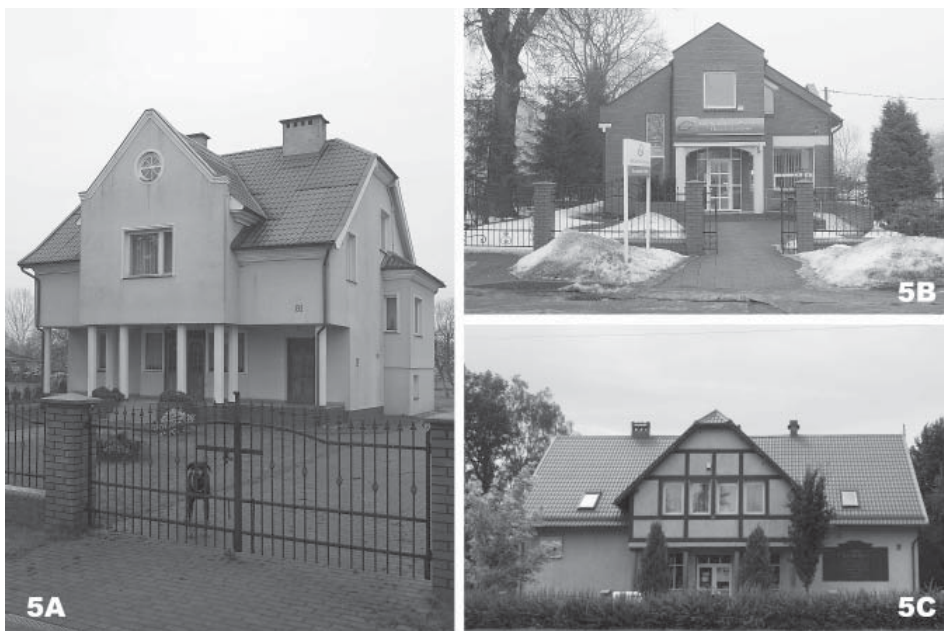
Fot. 5. Współczesne przykłady zastosowania podcienia: 5A – budynek mieszkalny w Ostaszewie, 5B – filia banku w Suchym Dębnie, 5C – sklep AGD w Drewnicy

Powojenna polityka przestrzenna kraju nie sprzyjała utrwalaniu cech tradycyjnego budownictwa ludowego. Drewniana architektura wsi utożsamiana była z zacofaniem i opóźnieniem cywilizacyjnym. „Podstawowym elementem architektonicznym polskiego pejzażu indywidualnego budownictwa był czworobok foremny, (...) bowiem w regularnej bryle pozwalał do maksimum wykorzystać owe dozwolone przez Prawo Budowlane 110 m kw. powierzchni” [Szarzyński 2012]. Na tych samych parcelach, obok rozpadających się drewnianych domów podcieniowych, skazanych na powolną zagładę, powstawały więc betonowe sześciany z płaskim dachem – synonim nowoczesności, a dla niektórych nawet elegancji. Jednak ostatnie dwudziestolecie – okres transformacji i uwolnienie prawa budowlanego od narzuconych norm powierzchniowych – przyniosły powrót zainteresowania budownictwem podcieniowym i próby jego adaptacji na potrzeby współczesnej architektury. Analizując nowo powstałe obiekty można wyodrębnić kilka zarysowujących się tendencji.