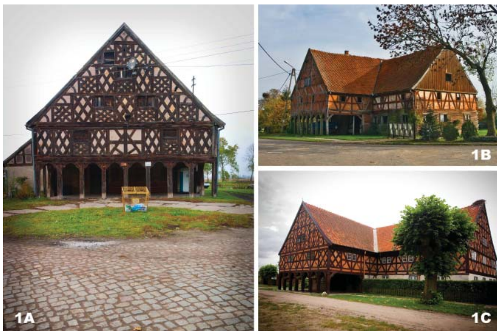
Fot. 1. Najstarsze domy podcieniowe: 1A. Klecie (1750 r.), 1B. Nowa Kościelnica (1750 r.), 1C. Trutnowy (1720 r.)