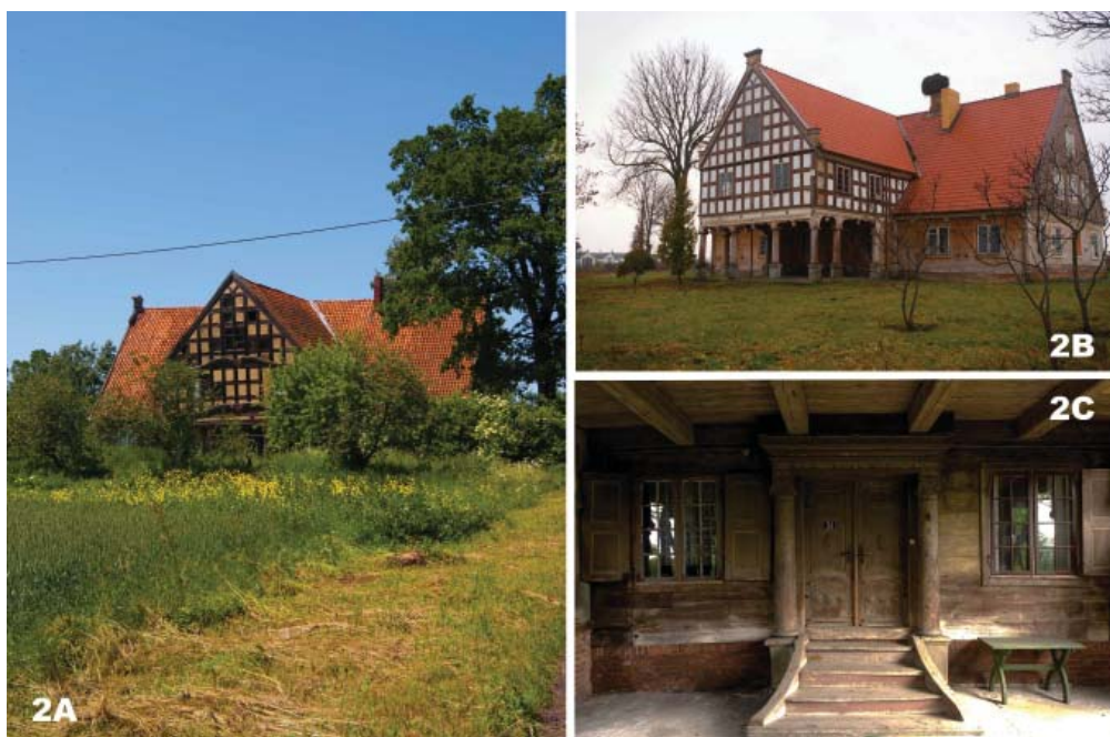
Fot. 2. Domy podcieniowe o cechach klasycystycznych P. Loewena: 2A – Orłowskie Pole, 2B – Orłowo, 2C – Marynowy.

pola wyznaczone przez drewniane elementy konstrukcyjne wypełniano cegłą lub gliną, zmieszaną ze słomą. Często przy wznoszeniu jednego obiektu łączono kilka technik naraz – przyziemie, bardziej narażone na powódzie, składano z belek na zrąb lub murowano z cegły, aby było odporne na działanie wody, a poddasze z podcieniem – z szachulca. Najstarsze konstrukcje ryglowe (dom w Kleciu fot. 1A czy Trutnowych, fot. 1C) charakteryzują się ciekawą, rozbudowaną formą pól elewacji szczytowych, utworzonych z rygli, zastrzałów i mieczy, w którą wprowadzono dodatkowo skomplikowany wątek cegieł. Późniejsze, klasycystyczne obiekty tego typu ulegają znacznym uproszczeniom – szachulec tworzy zgeometryzowaną szachownicę drobnych podziałów (fot. 2A i 2B, 3A), wzbogaconą gdzieś rozbudowaną linią gzymsu.