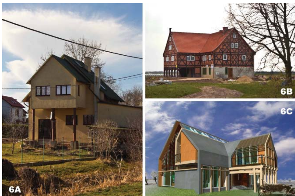
Fot. 6. Współczesne domy podcieniowe: 6A – podcień „szczytowy” w Oleśnie, 6B – historyzujący przykład domu w Osicach; 6C – wizualizacja projektu domu żuławskiego