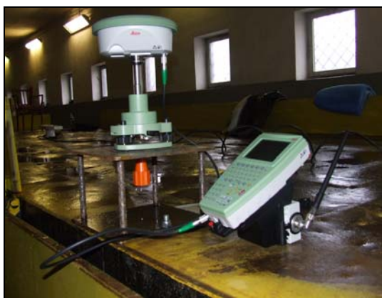
Rys. 1. Zestaw pomiarowy: SmartAnten typu ATX1230GG oraz kontrolera RX 1250

Projekt zakładał symetryczne rozmieszczenie czterech zestawów pomiarowych GNSS na platformie kolejowej. Na zestaw składał się odbiornik Leica System 1200 SmartRover, złożony ze SmartAnten typu ATX1230GG oraz kontrolera RX 1250 (rys. 1).