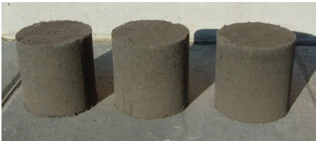
Zdjęcie 5. Próbkki mieszanki popiołowo-piaskowej stabilizowanej cementem