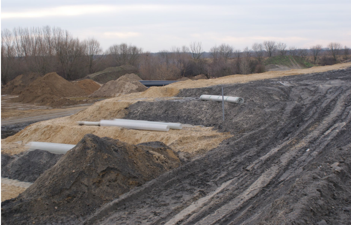
Zdjęcie 4. Fragment wykonanego nasypu. Widoczne fragmenty wykonane z samego piasku (skarpy) oraz mieszanka z UPS.