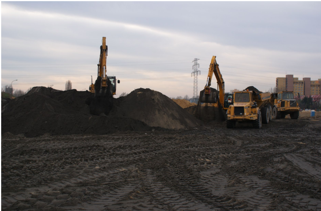
Zdjęcie 3. Najprostszy sposób mieszania UPS z piaskiem – za pomocą koparek