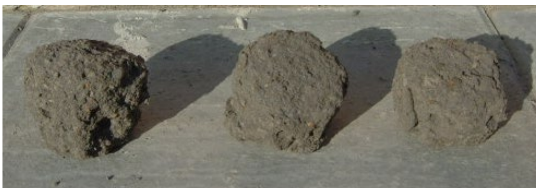
Zdjęcie 6. Próbkki mieszanki popiołowo-piaskowej stabilizowanej cementem po badaniu mrozoodporności

Patrząc na powyższe zdjęcia i wymagania zawarte w tablicy 5 można stwierdzić, że dla wielu materiałów spoistych uzyskanie wymaganego wskaźnika mrozoodporności będzie możliwe tylko przy zastosowaniu większej ilości spoiwa a więc i uzyskując jednocześnie dużo większe wytrzymałości. Ponieważ górne dopuszczalne wytrzymałości zostały zdefiniowane zupełnie inaczej jest to możliwe, ale zapewnienie tych parametrów musi odbyć się kosztem zwiększonej ilości spoiwa a więc i większych nakładów finansowych.