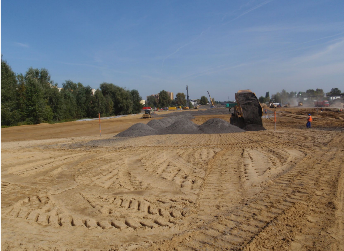
Zdjęcie 2. Transport UPS