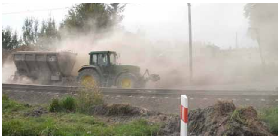
4. Rozkładanie spoiwa Tefra 15