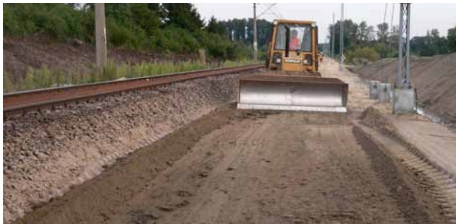
11. Profilowanie wykonanej warstwy podłoża