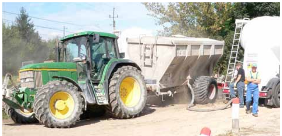
3. Załadunek spoiwa do rozsypywacza