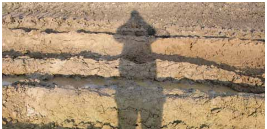
2. Widok gruntu przed stabilizacją