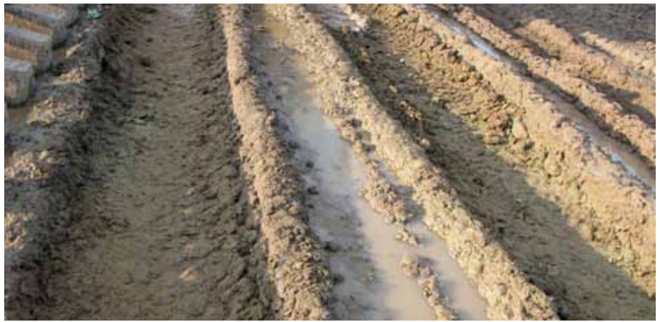
1. Widok gruntu przed stabilizacją

Na odcinku próbnym wykonano następujące sekcje mające pozwolić dobrać odpowiedni sposób wykonania całego zadania: