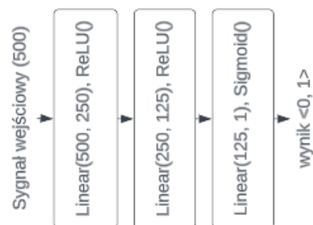
Rys. 1. Architektura sieci klasyfikującej sygnały

Do detekcji impulsów w obecności szumu i trendu opracowano sieć, której strukturę przedstawia rys. 1. Złożona jest ona z 3 warstw typu Linear. Dla pierwszych z nich zastosowano funkcje aktywacji ReLU, a dla ostatniej Sigmoid.